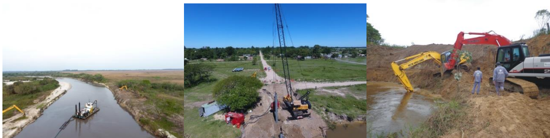
Obras Hídricas sobre: Arroyo Riachuelo, Defensa de Costa de Lavalle y adecuación de cauces