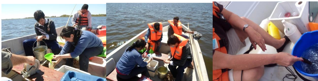
Monitoreo sobre la Laguna Iberá.

Conclusiones y resultados se notifican de manera periódica a la Asociación Correntina de Plantadores de Arroz (ACPA). Actividades: