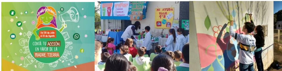
Actividades: “Contá Tu Acción En Favor De La Madre Tierra”

Se realizó un video de la actividad que fue presentado en la muestra “De la Tierra al Arco Iris” organizada por la Dirección de Ciencia y Tecnología del Ministerio de Educación y el Instituto Nacional de Tecnología Agropecuaria (INTA), realizada en el Colegio “Eloy Ortega” de la ciudad de Corrientes